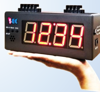
型名：STW-4S-EIO-CP ：STW-4S-EIO-RL 文字高さ約38mm