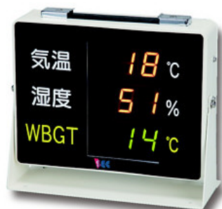
屋内用 型名: WBGT-IM01