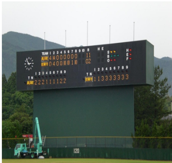
大型スコアボード