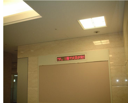
FAD96-8-(RGB) 用途: 緊急表示・火災報知器運動