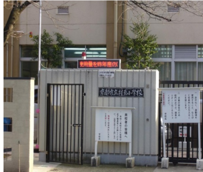
OSRDシリーズ 用途: インフォメーション・緊急表示