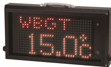
屋外用 型名: WBGT-S01