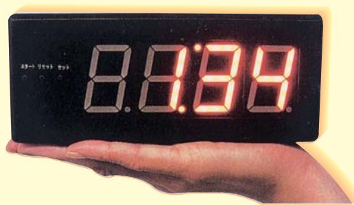
手のひらサイズのTSS-4S