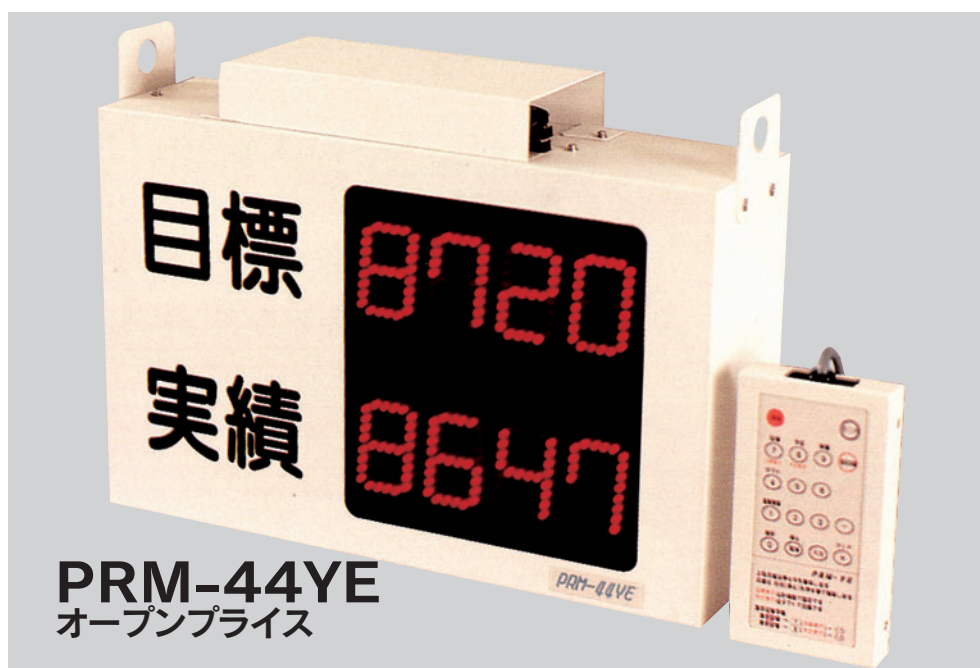
PRM-44YE オープンプライス