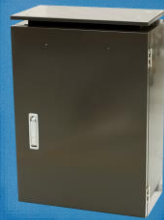
メッセージモニター LA(C)160-4(RG)-0